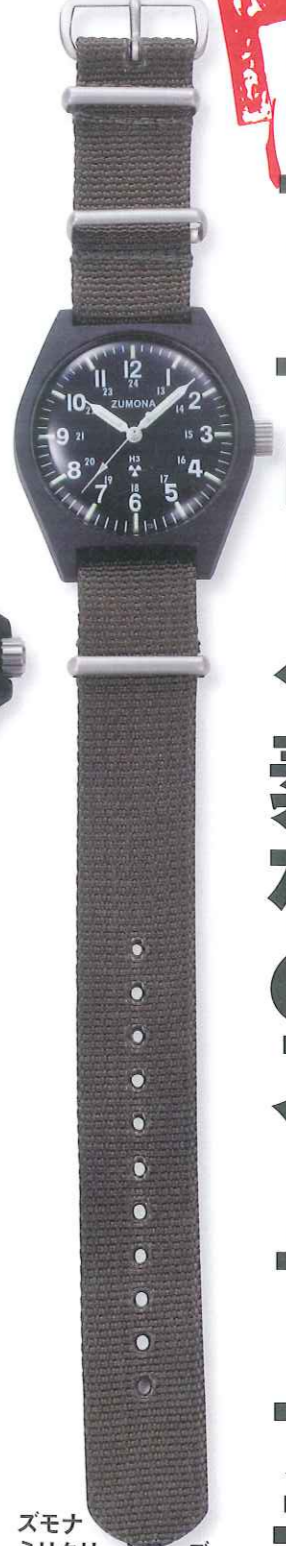
ズモナ ミリタリーシリーズ Ref. ZUM-WT0102 税込価格1万4700円

◎ビクトリノックス・ジャパン 砂漠をイメージさせるデザート・バ ージュはカーキよりも明るい色合 い。だからボロボロシャツとチノパンを 合わせたアウトドアルックには違 和感なくマッチ。ゴールドのソリッ ドアルミニウムベゼルがワンポイン ト装飾で小粋。10気圧防水。