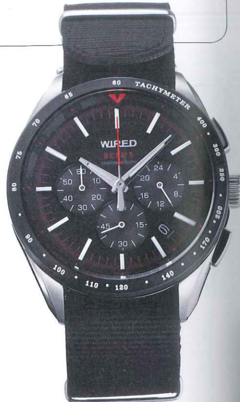
ブラック⇄ネイビー&レッド AGAW602 税込価格1万5750円

サックスブルーはオフタイムに使いたくなるカラーだ。一方、どんなものにも合わせやすいグレーに替えればデイリーユースに重宝。いずれも袖口に映えるアクセントのリボン。◎セイコーウォッチ お客様相談室