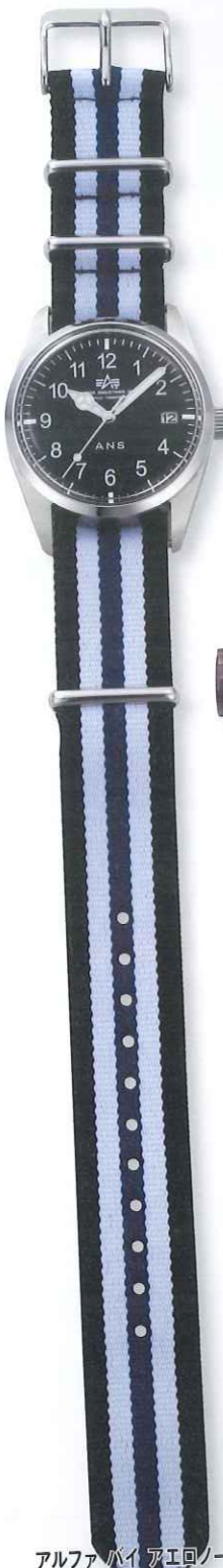
アルファ バイエロノティック タイプ・アーミー Ref.6550NB-BENY 税込価格8400円

◎ボールポジション キャラクターウォッチとリボン・ス トラップの組み合わせは子供用モ デルとして1970年代頃に大流行し た。この両手が指針のミッキーモ デルはいつの時代でも年齢や性別 を問わず、人気だ。日常生活防水。