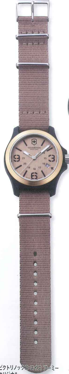
ビクトリノックス・スイス アーミー オリジナル Ref.241516 税込価格3万3600円

◎フォッシル ジャパン 枯れ草色を意味するカーキは光沢 あるブラウンレザーよりも秋冬 用の柔らかな色合いのアウトターに タイリングしやすい。このクロノ モデルはケースが重厚であるため ストラップをラグへ直接ジョイント させるタイプだ。10気圧防水。