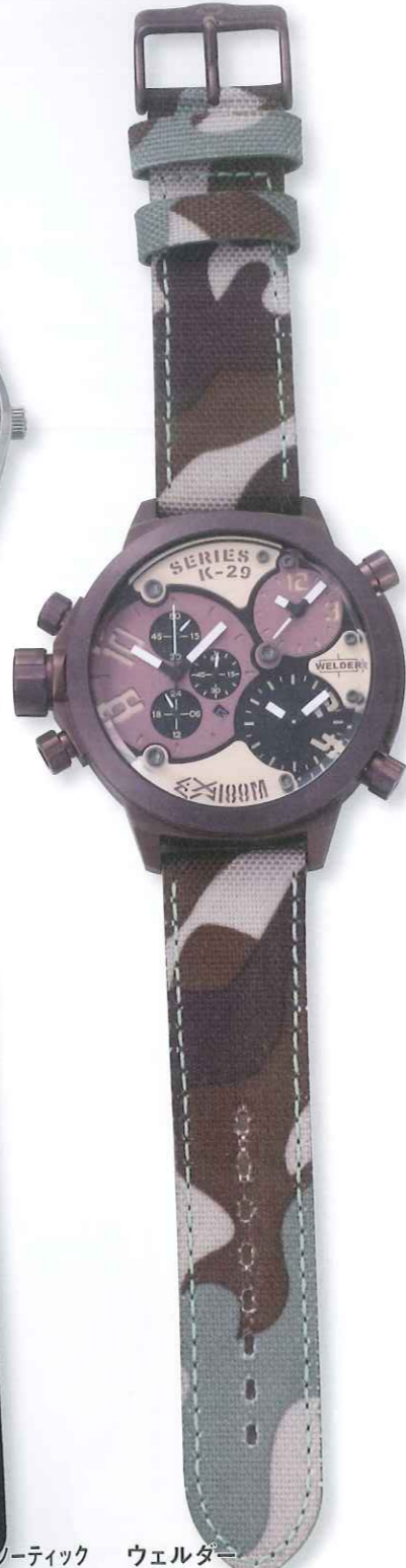
ウェルター K29 Ref.K29-8005 税込価格 各15万7500円

◎ウエニ貿易 フライトジャケットで有名なアルフ アのミリタリーウォッチ。通常はベ ルジュのストラップだが付属のリボ ン・ストラップはジェームズ・ボン ドのNATOタイプをブルーにアレ ンジ。プレビースタイルにもオス スメ。10気圧防水。