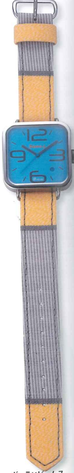
ポーラ×ビームス ポーラウォッチ2 税込価格9450円

◎ボールポジション 英国のトラッドなスタイルを醸すリ ボン・ストラップをコインエッジの 入ったベゼルの時計にセットして 格調あるアンティーク風に演出し たモデル。カラフルな服飾雑貨で 知られるロンドンのブランドのコレ クションだ。日常生活防水。