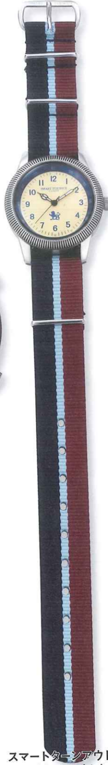
スマートターンアウト スマートターンアウトウォッチ Ref.ST-002RAF 税込価格1万2600円

◎ボールポジション 英国のトラッドなスタイルを醸すリ ボン・ストラップをコインエッジの 入ったベゼルの時計にセットして 格調あるアンティーク風に演出し たモデル。カラフルな服飾雑貨で 知られるロンドンのブランドのコレ クションだ。日常生活防水。