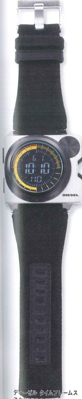
ディーゼル タイムフレームス スタジオミキサー Ref.DZ7222 税込価格2万2050円

◎ビームス タイム グレーのストライプとイエローのコ ンビがユニークなリボン・ストラ ップは壁掛け時計をダウンサイジング したかのような。パステルブルーのス クエアダイヤルは、さわやかで優 しい印象を与える。男女兼用でも 楽しめるモデルだ。日常生活防水。