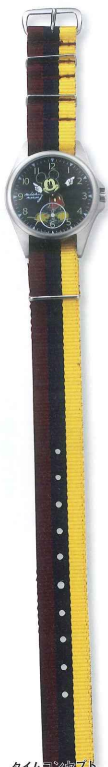
タイムコンセプト ミッキーマウスウォッチ Ref.DM01-SBK 税込価格 各1万500円

昨今のファブリック素材のストラップは、 ブランドや時計のデザインをセレクトするのと同じく、 織りの色彩が豊富で好みのカラー選びが楽しめる。 それこそがレザーやプレスと異なるファブリックの注目されている理由だ。