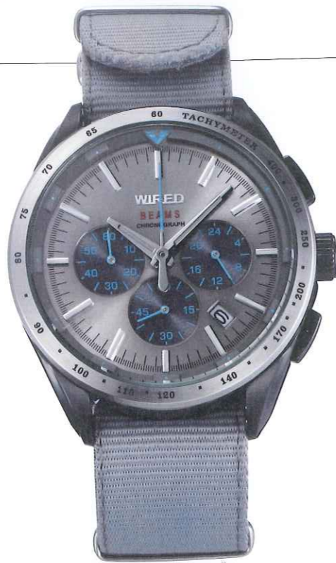
グレー⇄サックスブルー AGAW603 税込価格1万5750円

ビームスカラーのオレンジが冴える。サブダイヤルのミリタリーやアウトドアウェアにうってつけのリボン。毎回、即売のコラボだけに各色200本の今回もヤバそう。◎セイコーウォッチ お客様相談室