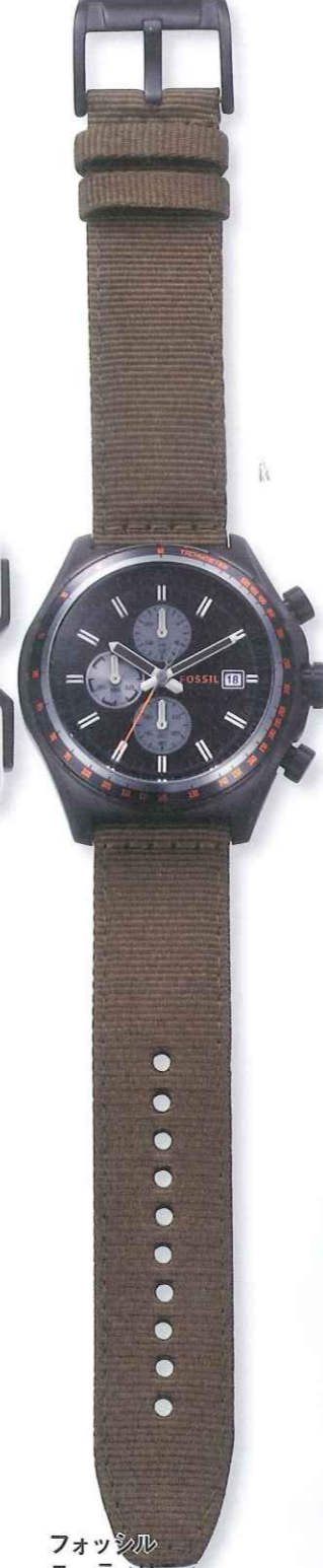
フォッシル ユーティリティー Ref.CH2781 税込価格1万7325円

◎フォッシル ジャパン スタンダードなブラックはあらゆる タイプの時計に合わせられる。こ の近未来的デザインのデジタルにも 好感触だ。オーディオ製品から 着想を得たモデルだけに、ギタ ーのストラップに多用されるコットン を素材に採用。5気圧防水。